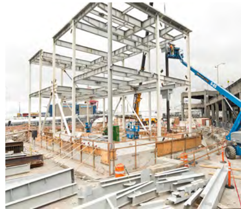
Makikita ang gusali ng mga operation sa timog ng mga nagmamanehong patungong hilaga, sa hilaga lang ng pasukan ng lagusan. Dito mananatili ang mga sasakyang pangkumpuni, mga ventilation fan at pang-emergency na kuryente.