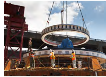
Nag-install ang mga tauhan ng bahagi ng bagong disenyo seal system upang protektahan ang bagong main bearing ng makina.