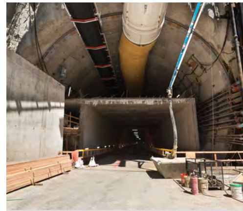
Unti-unting nabubuo ang kalsada sa loob ng lagusan sa panghinaharap na pasukan sa timog.