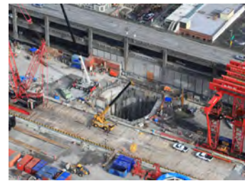
Tanaw ng hukay ng pasukan sa lagusan mula sa himpapawid.