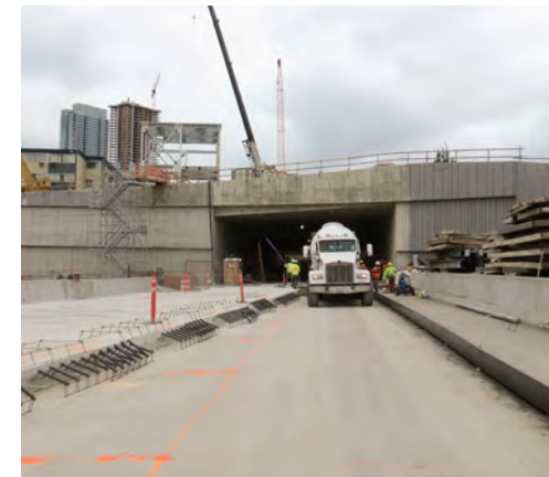
Nagawa nang aspalto ng mga tauhan ang panghinaharap na kalsadang patungong timog sa pasukan sa hilaga.