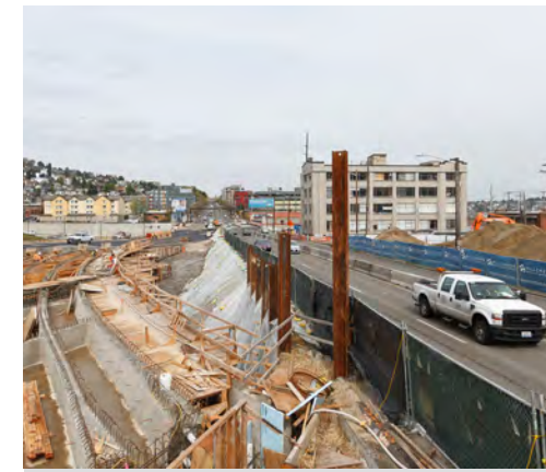
Abala ang mga tauhan sa paggawa sa koneksyon sa pagitan ng lagusan at Aurora Avenue North pati na rin ang mga bagong pasukan at labasan sa Republican Street.