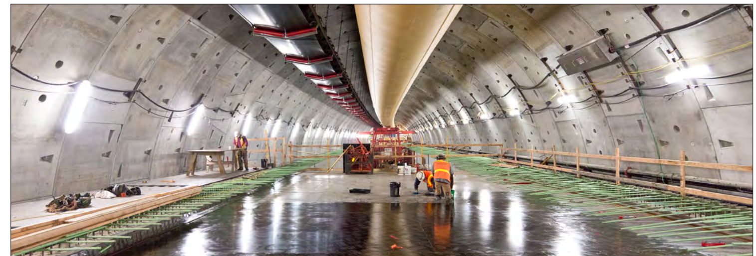
Ginawa ng mga tauhan ang isang bahagi ng panghinaharap na kalsadang patungong timog ng lagusang SR 99.