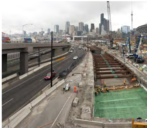
Ginagawa ng mga tauhan ang panghinaharap na mga kalsadang patungong hilaga sa pasukan ng lagusang SR 99 malapit sa mga stadium ng Seattle. Ang bahaging ito ng lagusan ay magkakaroon ng habang 1,500 talampakan, na magkokonekta sa itaas hanggang sa hinukay na bahagi ng lagusan.