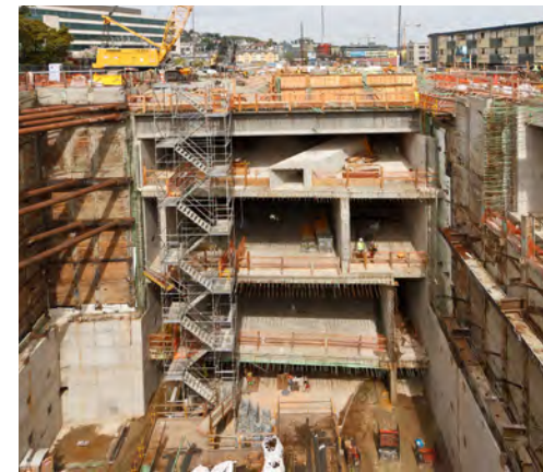
Nagpapatuloy ang konstruksyon sa pasukan kung saan matatapos ang trabaho ng makinang panghukay ng lagusan.