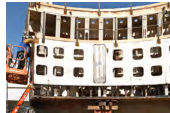
Nagdaragdag ang isang welder ng panlabas na harang sa makinang panghukay ng lagusan