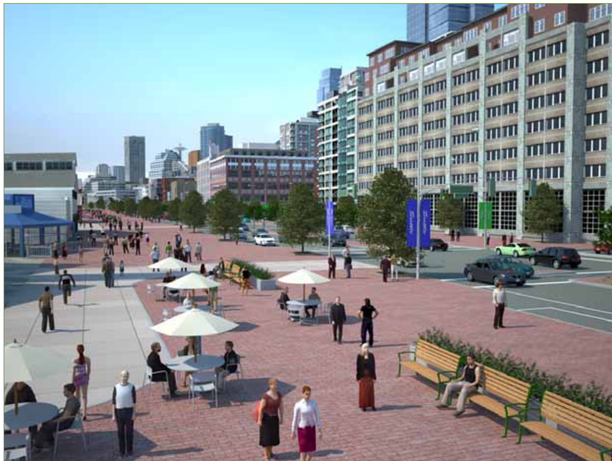
Concepto inicial de lo que será el paseo Alaskan Way y la zona costera.

WSDOT, el Condado King y la Ciudad de Seattle están avanzando en el reemplazo del Muro de Contención y Viaducto Alaskan Way, debido a su vulnerabilidad ante los sismos, con un túnel excavado debajo del centro de la ciudad, una nueva calle costera, inversiones en tránsito y mejoras en las calles costeras e interiores del centro de la ciudad. Esta solución: