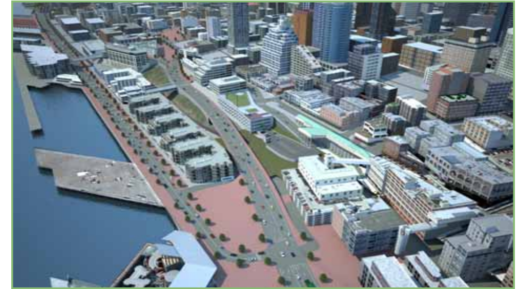
Concepto inicial del nuevo Alaskan Way y la conexión con Elliott Avenue y Western Avenue.

El nuevo boulevard tendrá cuatro carriles (dos carriles en cada dirección) además de carriles para dar la vuelta entre las calles Pike y Columbia. Alaskan Way tendrá seis carriles al sur de Columbia Street para adaptarse al tráfico del trasbordador. Todas las intersecciones tendrán señales que se programarán para permitir que el tráfico fluya con eficiencia. Los cruces señalizados para peatones permitirán el acceso seguro de peatones a la zona costera y más previsibilidad para los vehículos.